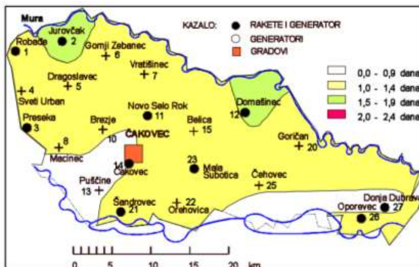
Slika 3: Prostorna raspodjela srednjeg broja dana s tučom i/ili sugradicom za vrijeme sezone obrane od tuče. Međimurske županija, 1981.–2000.

Sezona operativnog provođenja djelovanja na tučonosne oblake na području Međimurske županije provodi se od 1. svibnja do zaključno 30. rujna. Na području Općine Mala Subotica nema stanica za obranu od tuče.